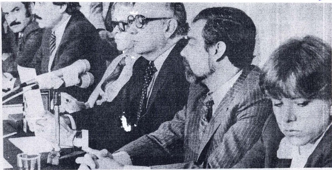
Momento en que el Rector de la UNAM da lectura al acuerdo.

an el artículo 34, fracciones IX y X, del subrayó que por su importancia na- reintroducción de la flora y la fauna tividades académicas y de investi-